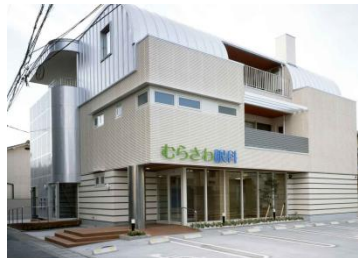
施設 外 観