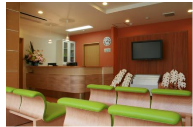
待 合 室