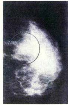
石灰化でがんが見つかったマンモグラフィの画像

乳がんは9割が「しりとり」によって発見されています。触診で分からない乳がんの多くは、マンモグラフィ(乳房エックス線撮影)検診や超音波検査で発見されています。市町村で行われている公的乳がん検診は、マンモグラフィと視触診。マンモグラフィは若い人では乳がんの発見率が高くないので、40歳以上